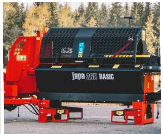
JAPA 365 Basic