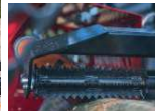
ozubený přítlačný válec před lištou