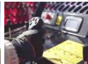
ovládací panel Japa 405