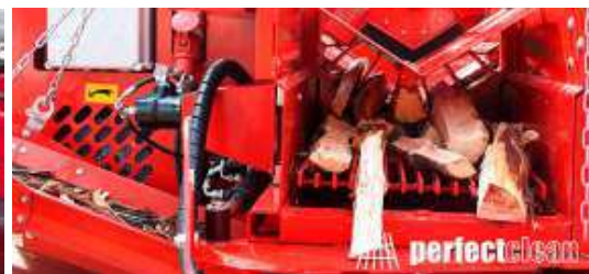
perfect clean & perfect split Japa 405